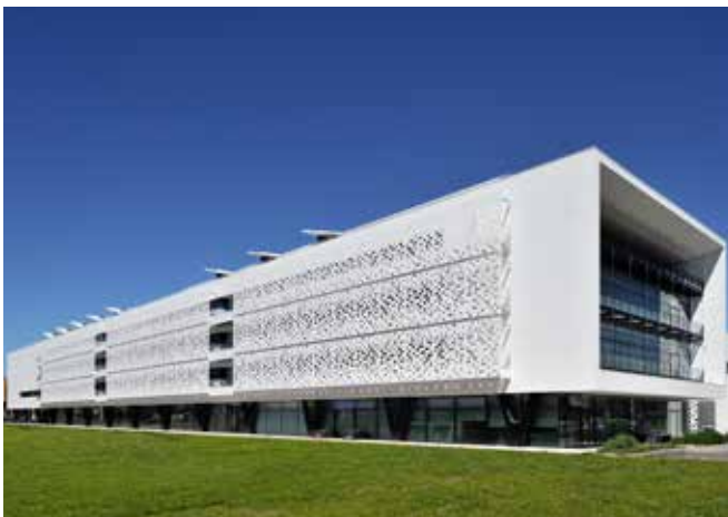
Institut d'Optique - Talence

Parmi les dernières nouveautés, les chantiers les plus importants en terme de superficie (7.000 m 2 ) et réalisé en Krion® en Europe à ce jour est celui de l'Institut d'Optique de Talence, près de Bordeaux, vient ensuite le siège social du Crédit Agricole à La Rochelle, avec 6000 m 2 de façades en Krion®.