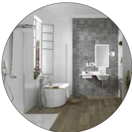
LUIS VIDAL COLLECTION MOOD