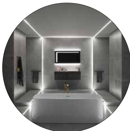
SIMONE MICHELI COLLECTION LOUNGE