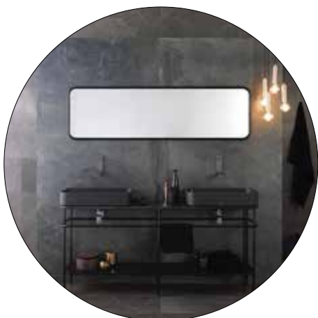
YONOH COLLECTION VINTAGE