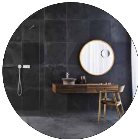
NORMAN FOSTER COLLECTION TONO