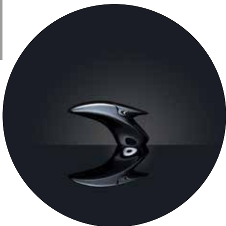
ZAHA HADID COLLECTION VITAE