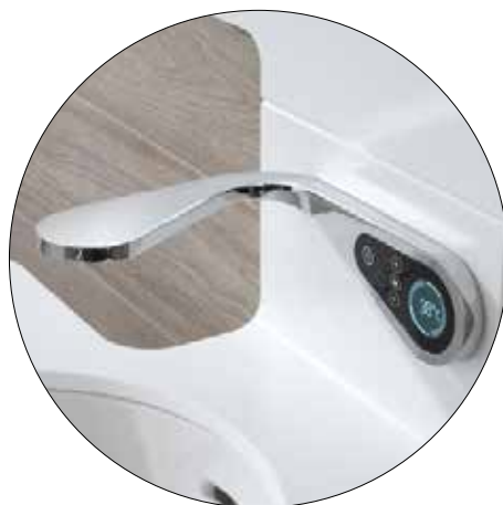
RICHARD ROGERS COLLECTION MOOD