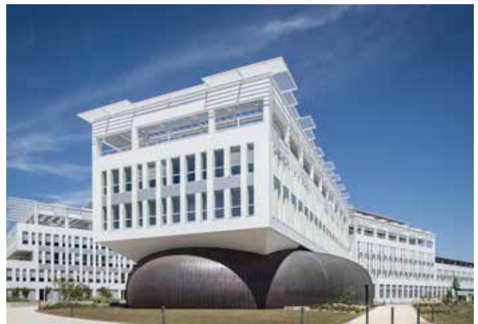
Siège Social Crédit Agricole - La Rochelle